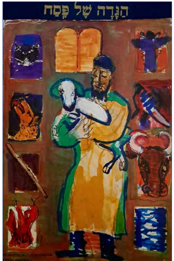
Den judiska påskritualen, Påskhaggadan, med svensk översättning (1983).

Nästan alltid när antijudiskhet hämtar näring från såväl Gamla som Nya testamentet och kristen teologi, tro och bekännelse, visar det på en brist i den kristna bibeltolkningen och trostraditionen. Det må räcka med ett känt exempel som anknyter till texter som är särskilt aktuella just nu. Vem har inte hört att de som ropade "Hosianna!" på Palmsondagen skulle ropa "Korsfäst!" på Långfredagen? Poängen är alltså att samma människor som sjöng "Hosianna!" snart skulle skrika "Korsfäst!". Denna utläggning är så vanlig, att det nog ofta rör sig om ren tanklöshet som i sin tur beror på en lika omedveten böjelse att tolka allt till det värsta för "judarna" som opålitliga och falska för att sedan kunna framställa dem som det varnande typexemplet för kristna.