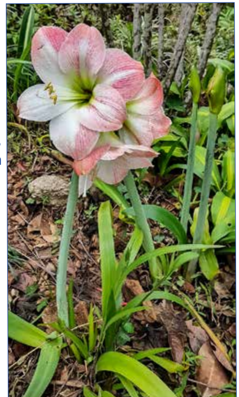
I Hong Kong växer amaryllis vilt.

Men nu får vi alla njuta desto mer och än en gång uppleva hur naturen vaknar till nytt liv. Trots oväder och hårda stormvindar som viner över världen i denna oroliga tid, får vi ta emot naturens dukade bord med glädje och tacksamhet, kanske med J O Wallins ord i vårpsalmen 197: