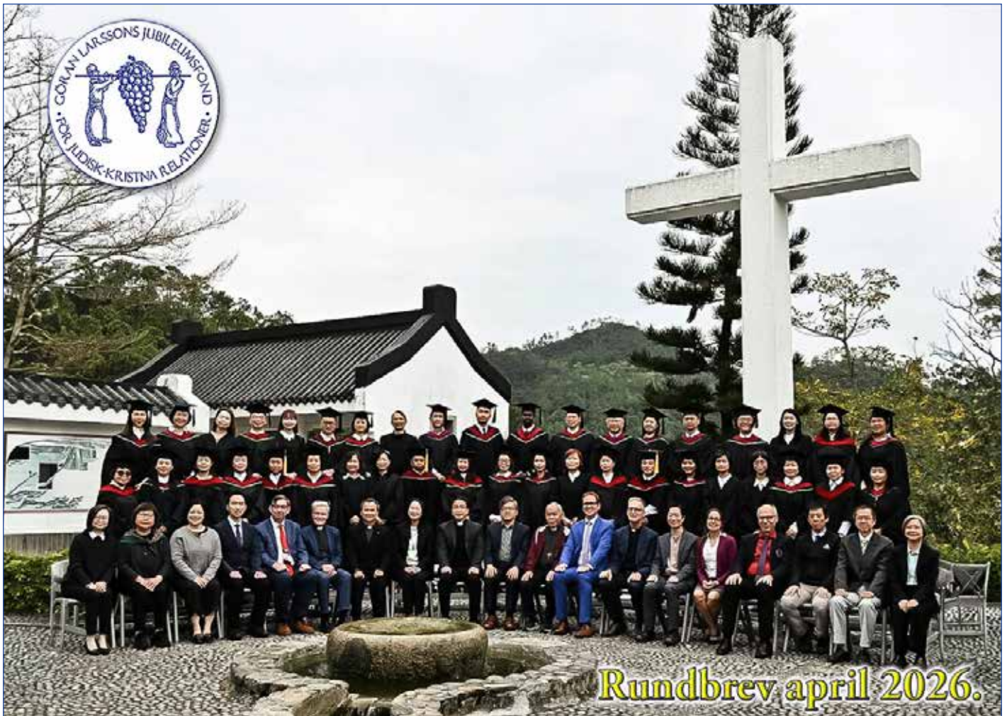
Bild från Hong Kong med årets utexaminerade studenter med sina lärare i en vacker omgivning.