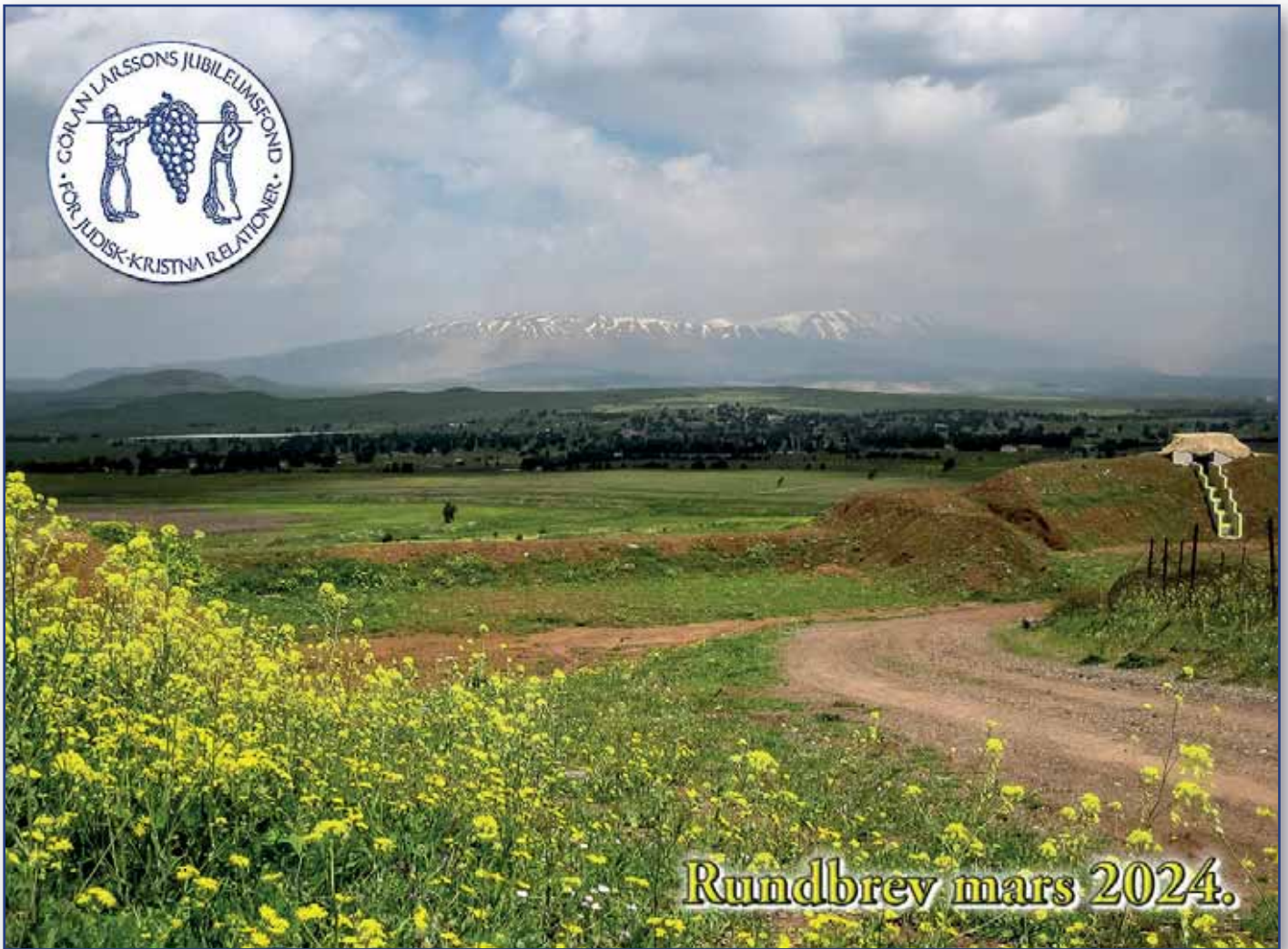
Berget Hermon är snötäckt långt in på våren...