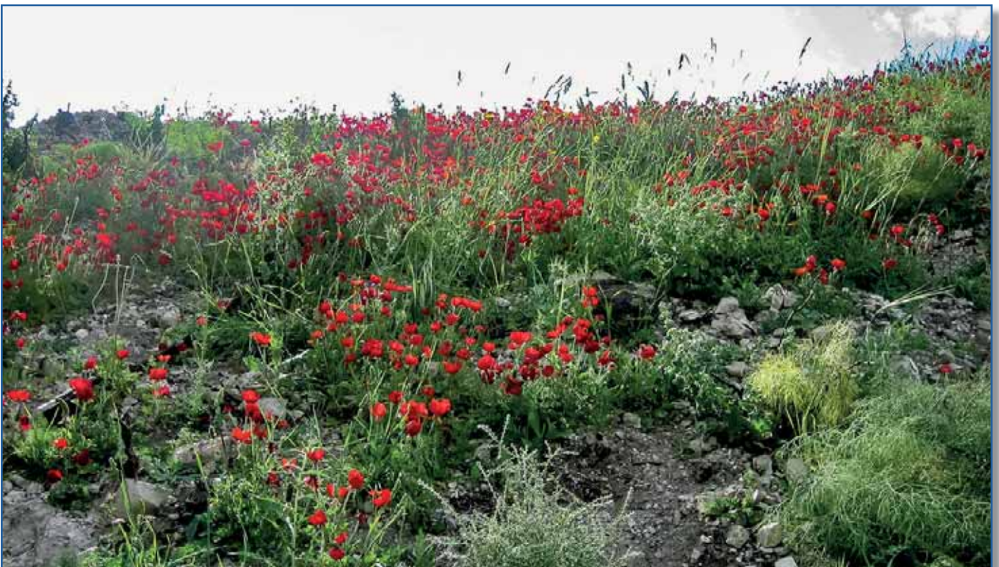
Vallmon blommar.

Den här lilla historiska exkursionen med utgångspunkt i Esters bok och purimfesten får bli ännu ett exempel på hur den bibliska historien blir konkret och levande på ett särskilt sätt i mötet mellan kristna och judar. Den Gud vi möter i Bibeln är en Gud som uppenbarar sig i historien för människor av kött och blod som är sig väldigt lika från tid till annan, eller som någon sagt: "Ordet från himmelen står med båda fötterna på jorden." Gudsordet har överlämnats och utlämnats till människor som i lust och nöd vittnat både om Guds närvaro och frånvaro, om hopp som uppfyllts eller grusats för att tändas på nytt. Så skulle jag kunna sammanfatta temat för årets sommarkurs, som ska få handla om just det messianska hoppet, alltså det hopp som växte fram i det judiska folkets historia, alldeles särskilt i tider när Gud verkade ha övergivit sitt folk och svikit sina löften och folket avfallit. Många kan nog känna igen sig i den beskrivningen i den orostid som präglar vår värld just nu. Mitt i mörkret fortsatte dock hoppets låga att flämta – hoppet om en räddare, en som skulle upprätta och återställa inte bara sitt förbundsfolk utan alla folk som på olika sätt vandrade i mörkret. För både judar och kristna kan detta hopp sammanfattas i ett namn: Messias.