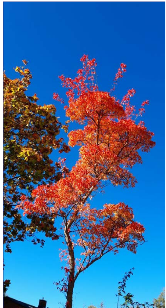
Höstens färger kan vara betagande.

Som ni ser är höstens program långt ifrån fyllt. Jag vill därför betona att jag står till förfogande för er som på olika sätt vill ordna program som kan väcka djupare kunskap och intresse för Bibeln, i synnerhet de långa och djupa sambanden mellan ”GT” och NT, olika aspekter av judisk tro och judiskt liv och vad som hänt och händer i relationen mellan judar och kristna. Det kan gälla medverkan i gudstjänster, församlingsaftnar, utbildning och seminarier.