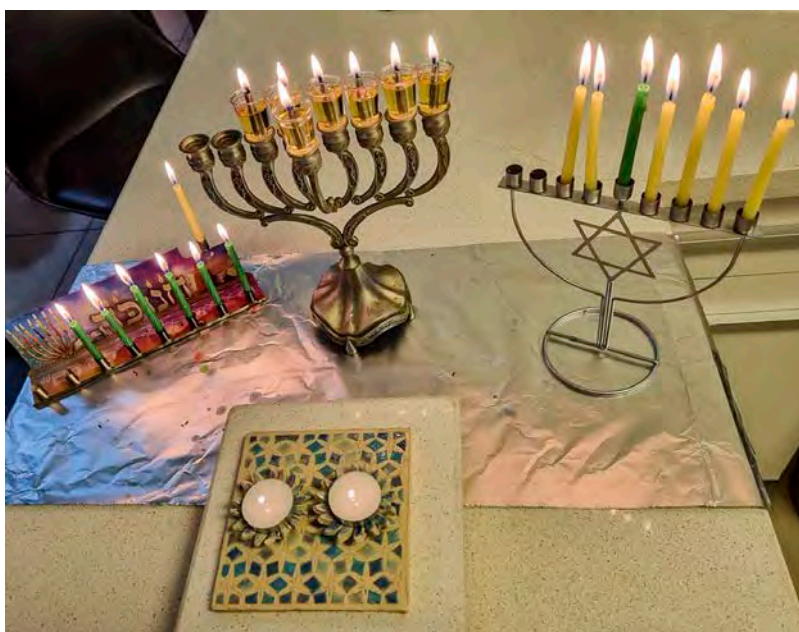
Den här bilden fick jag igår kväll av vänner i Jerusalem som jag lärde känna redan 1972. Den påminner om att det sjätte chanukkaljuset tändes tillsammans med de båda sabbatsljusen.

Jag beklagar verkligen att detta jul- och nyårsbrev kommit att handla mera om mörker än om ljus. Men världen är mörk, och det hjälper inte att förtiga eller förneka det. Det enda som hjälper mot mörkret är ljuset, och mörkret har inte fått den slutgiltiga makten över ljuset. Om det påminner chanukka- och adventsljusen, Lucia och den stora högtid som stundar. Vi får låta varje ljus vi tänder bli ett litet uttryck för det hoppet. Än är inte sista ordet sagt. Kyrkan ägs inte av någon här på jorden. Här vill jag gärna citera de ord som avslutade adventsgudstjänsten i S:ta Clara kyrka i söndags: "Kyrkans framtid är god, eftersom kyrkans framtid är Jesus Kristus."