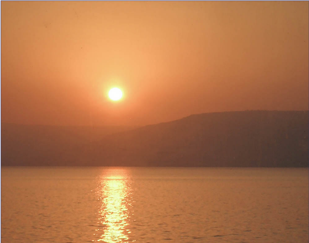
Soluppgång över Golan vid Genesarets sjö.

Jag kan inte räkna alla karikatyrer jag sett i vår som framställer judar på ett sådant sätt att man ser likheten med den kända modellen av coronaviruset. Det är en modernare variant av 30-talets jämförelser mellan judar, smitta och skadedjur. Värst av alla är Iran och de terrororganisationer som de stöder, framför allt Hizbollah i Libanon och Hamas i Gaza, men denna typ av antisemitism är vida spridd i kretsar där Mellanösternkonflikten står högt på den politiska agendan.