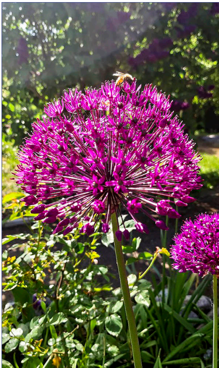
Kirgislök, Allium Aflatunense, eller "Purple Sensation".

Detta år kommer tveklöst att gå till historien, precis som 1918 då spanska sjukan satte sina outplånliga avtryck på en redan sargad värld. Omkring 500 miljoner människor – kanske nästan en tredjedel av världens befolkning – beräknas ha smittats. Dödstalen är osäkra men anges ofta