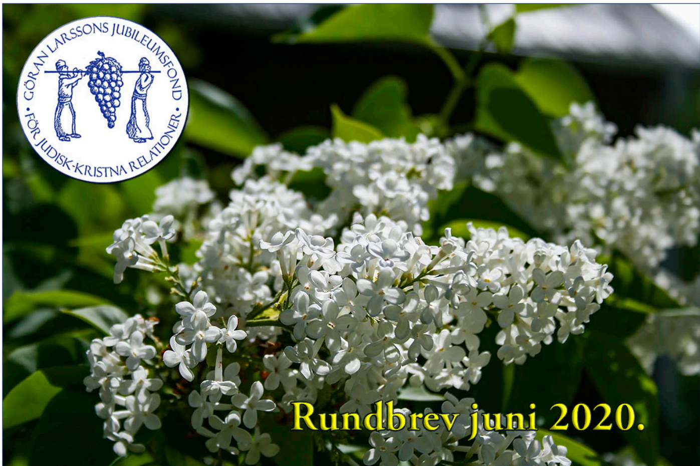
Syrénera blommar