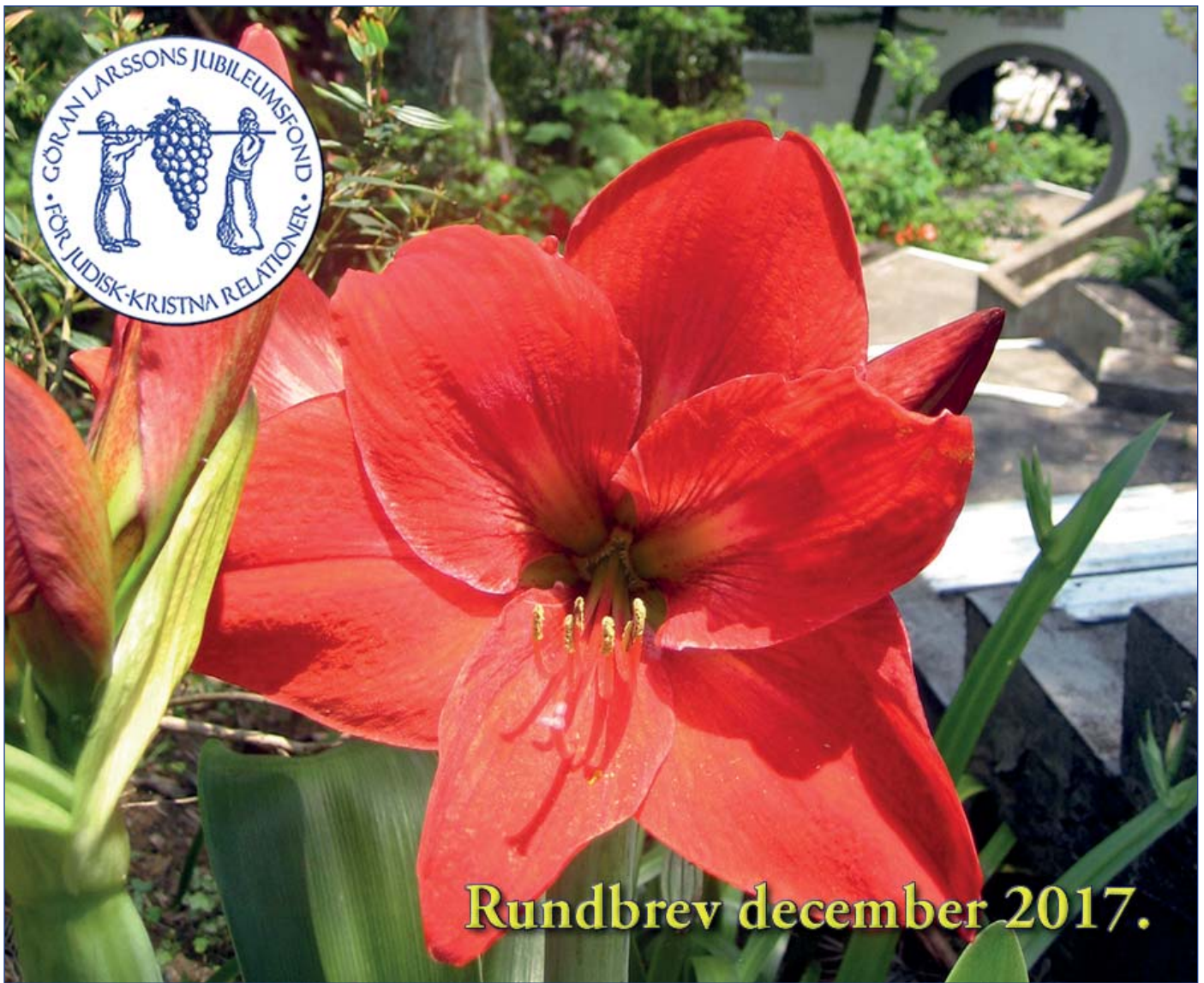
Julblommor i Hong Kong.