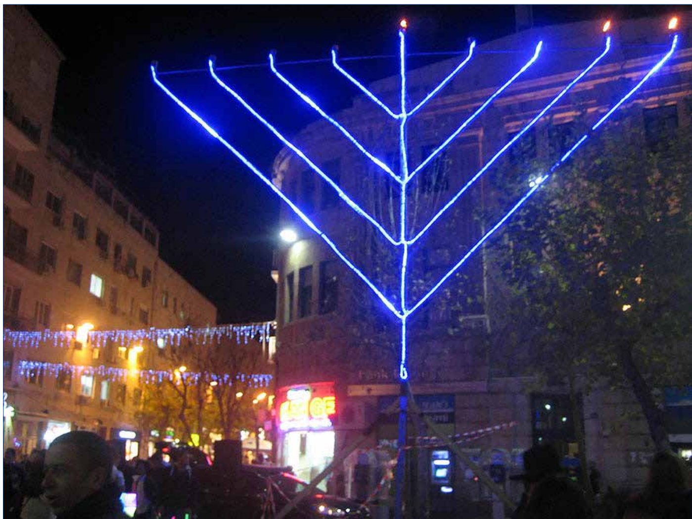
Andra chanukkaljuset tänds i år på juldagen. Bild från Sionstorget i Jerusalem.